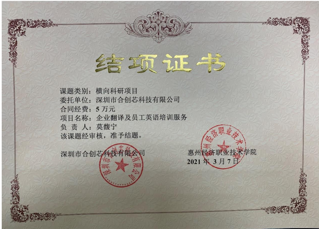
图5 深圳市合创芯科技有限公司委托横向科研课题《企业翻译及员工英语培训服务》