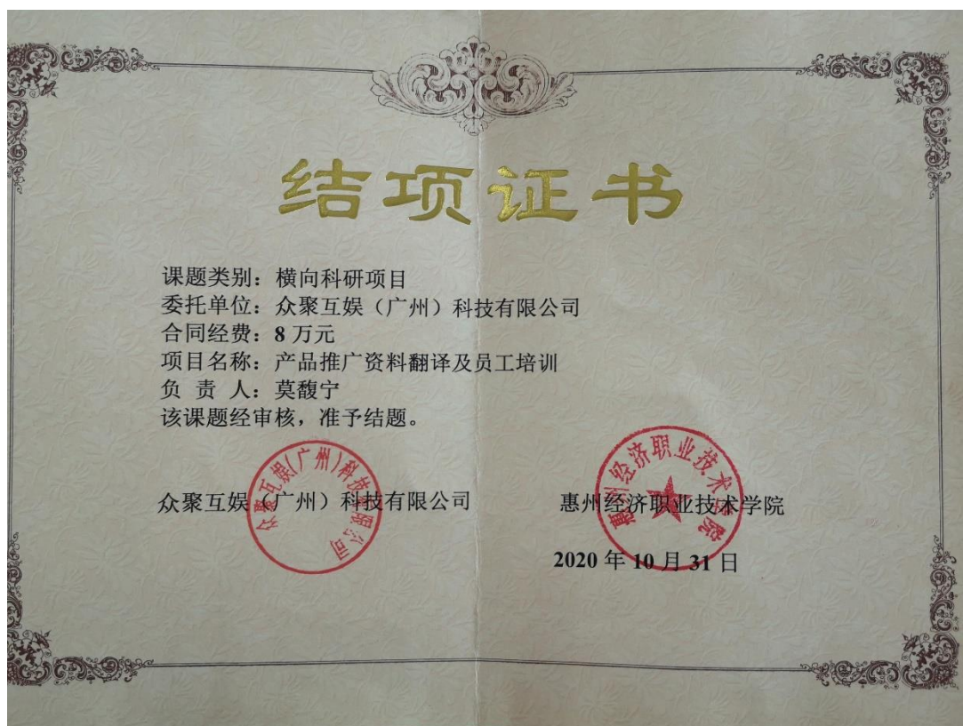
图4 完成众聚互娱（广州）科技有限公司委托横向课题《产品推广资料翻译及员工培训》