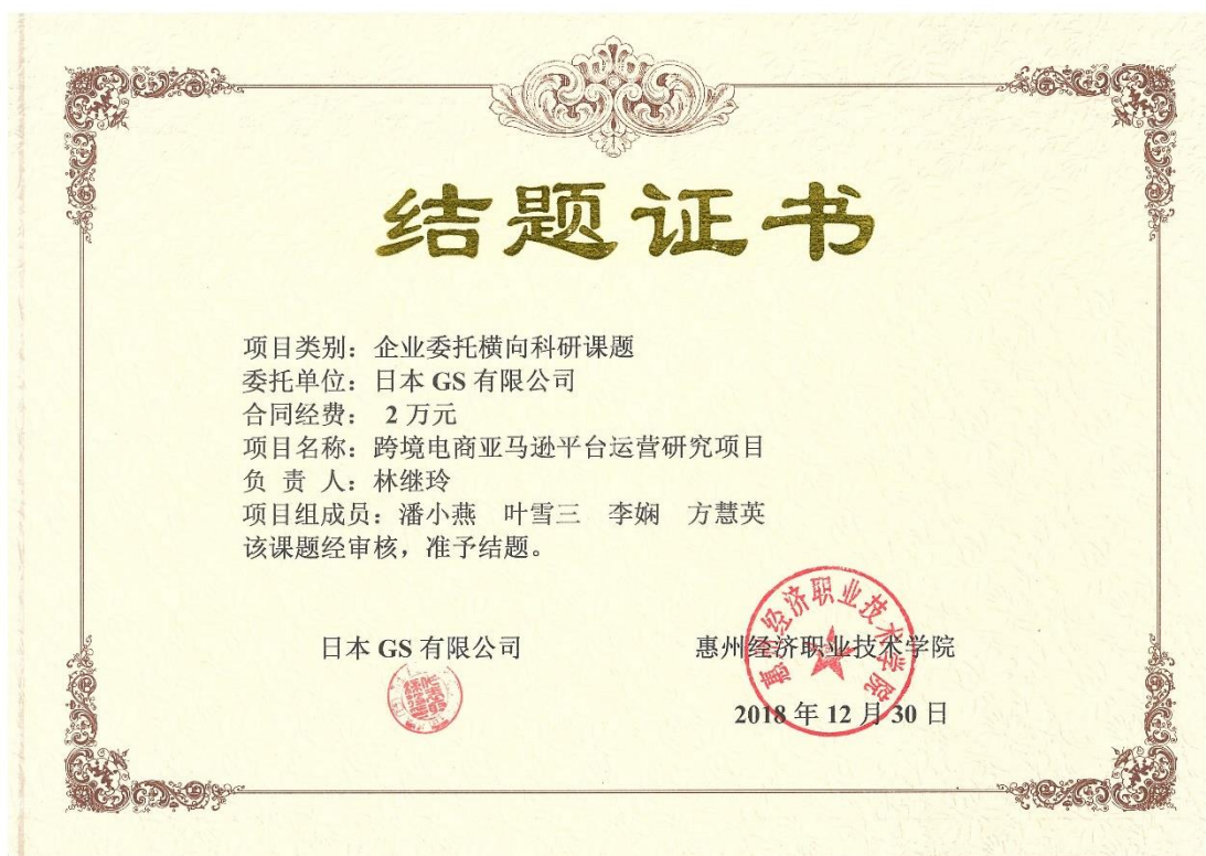
图 2 完成日本 GS 公司委托横向课题《跨境电商亚马逊平台运营研究项目》