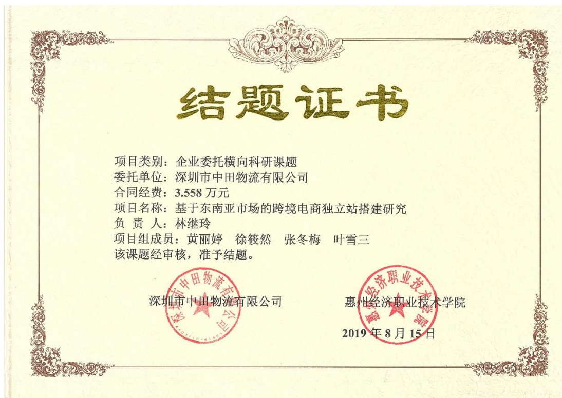
图3 完成深圳市中田物流有限公司委托横向课题《基于东南亚市场的跨境电商独立站搭建研究》