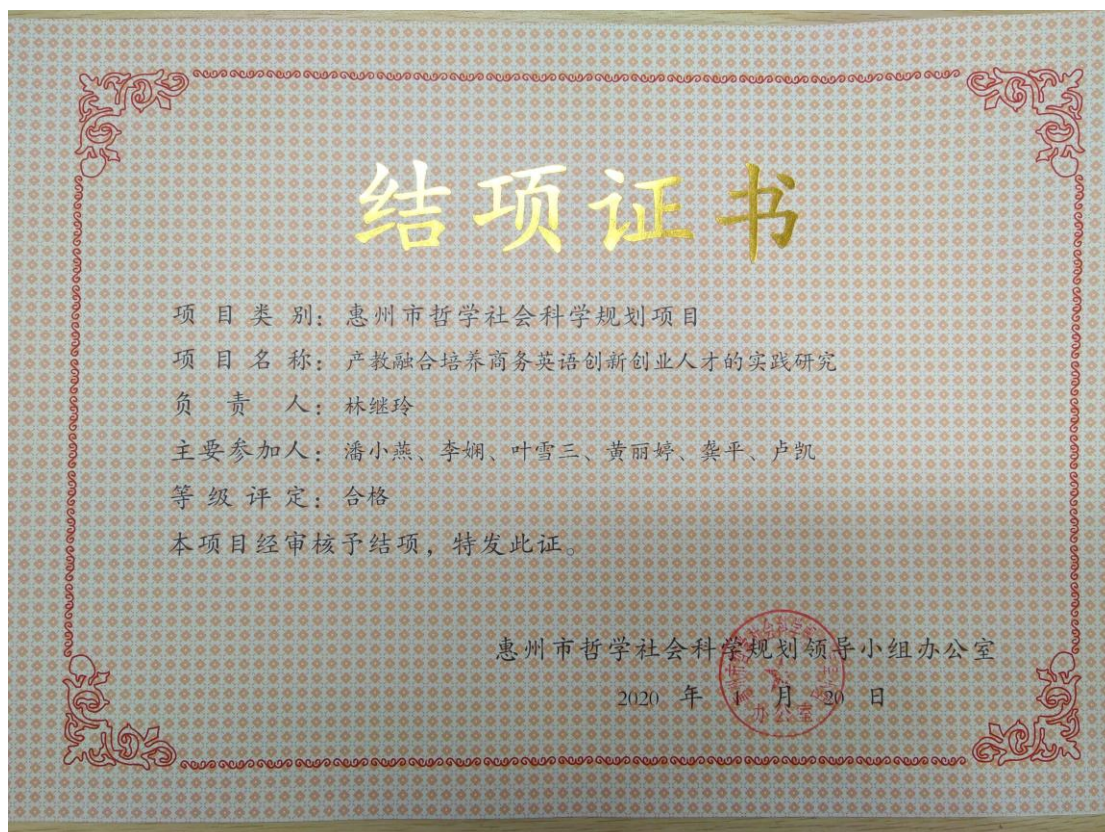
图3 2019年度惠州市哲学社会科学规划项目结项证书