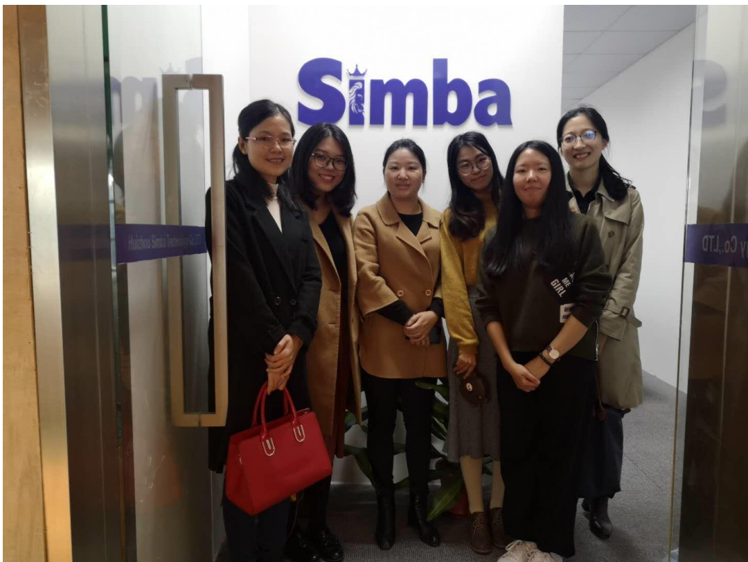
图 7 商务英语专业学生在惠州辛巴科技有限公司集中实习