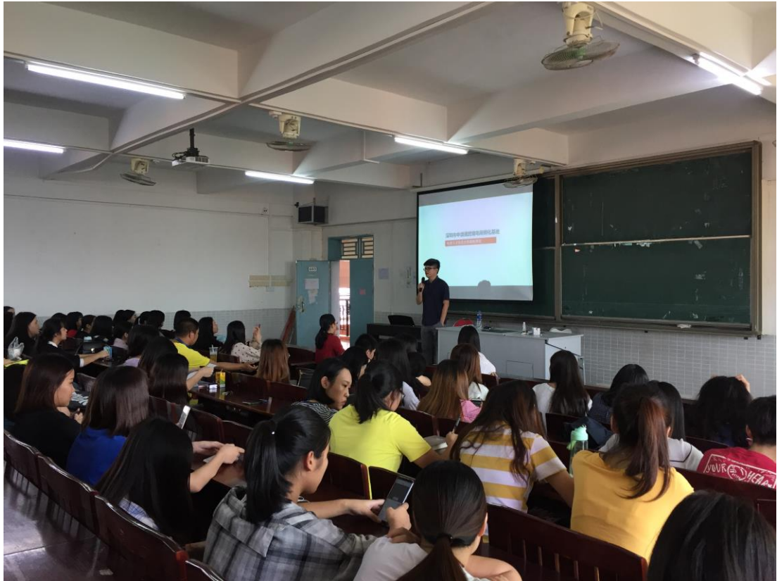
图 10 深圳中澳通网络信息有限公司来我校开展亚马逊人才岗前培训宣讲会