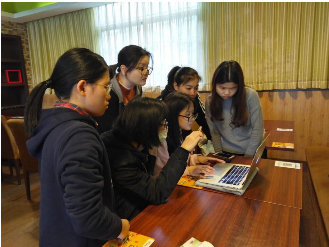
图 3 师生团队参加日本 GS 有限公司亚马逊平台运营