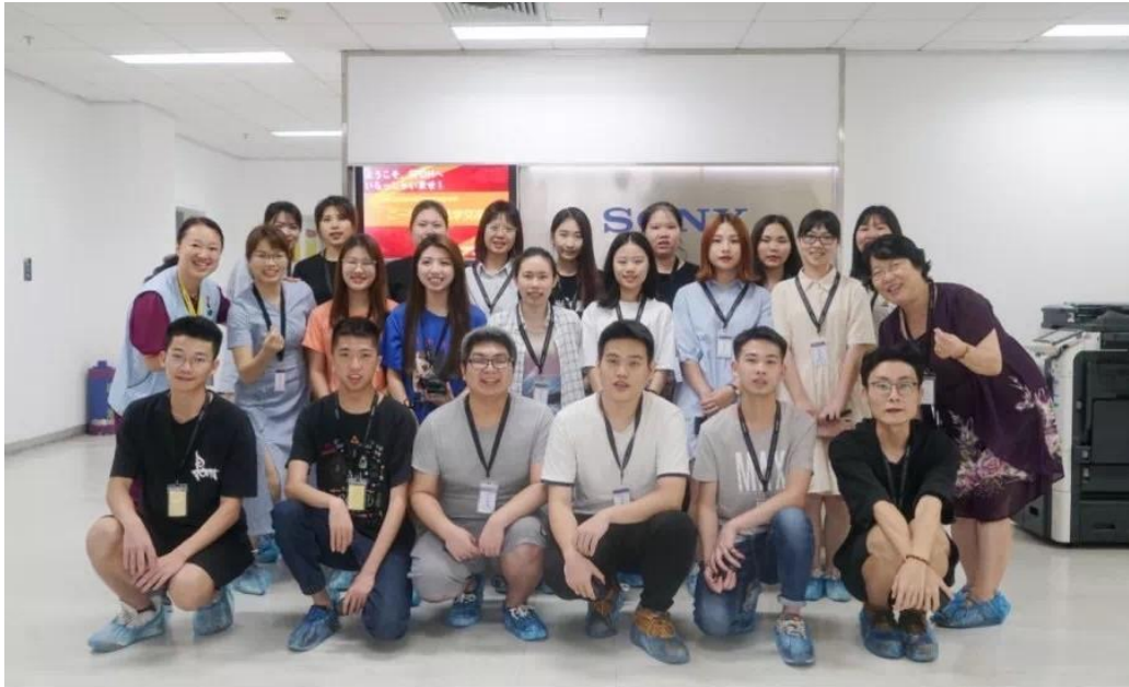
图 24 2018 级商务日语专业学生前往企业索尼精密部件（惠州）有限公司参观