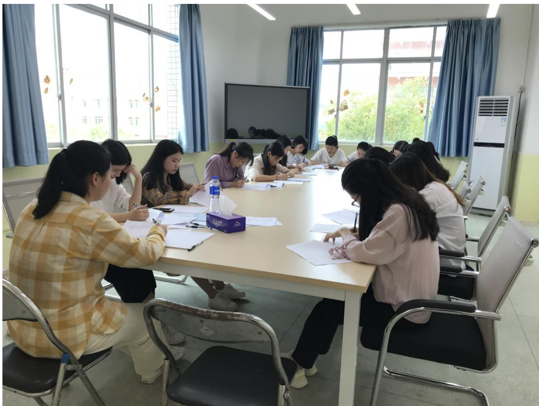
图 11 深圳市新一洲电子商务有限公司来校招聘商务英语专业实习生，学生参加笔试