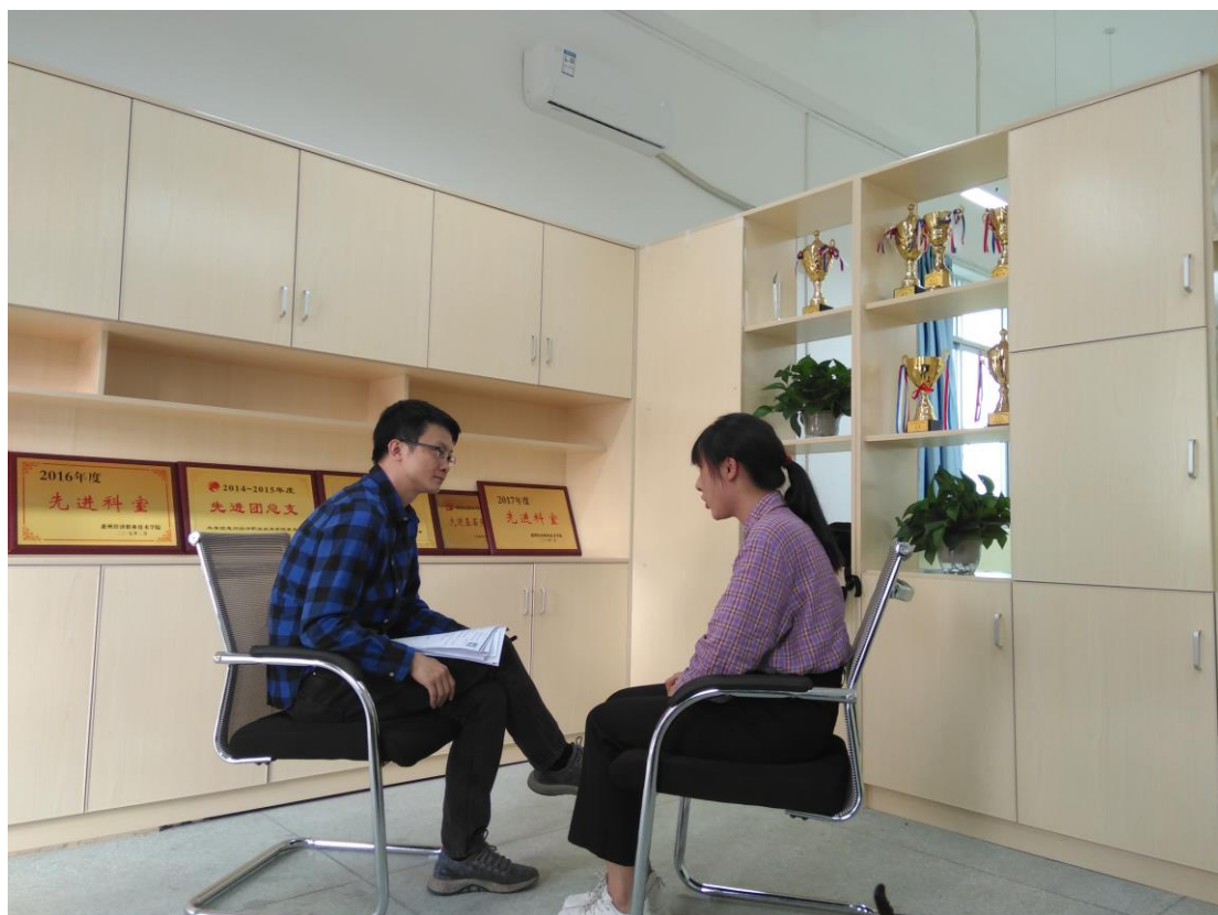
图 12 深圳新一洲市电子商务有限公司来我校招聘商务英语专业实习生，学生参加面试