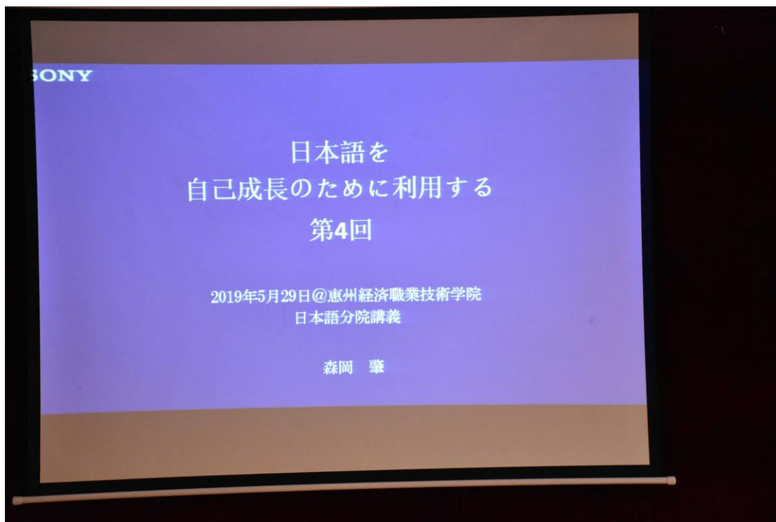
图 20 2019 年我校名誉教授森岡肇先生日语主题讲座