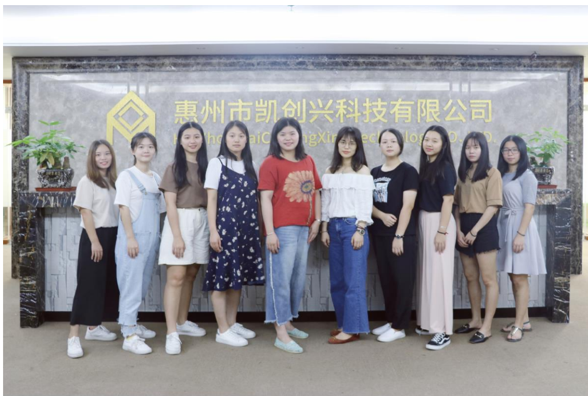
图1 2016级商务英语专业学生在惠州市凯创兴科技有限公司集中实习