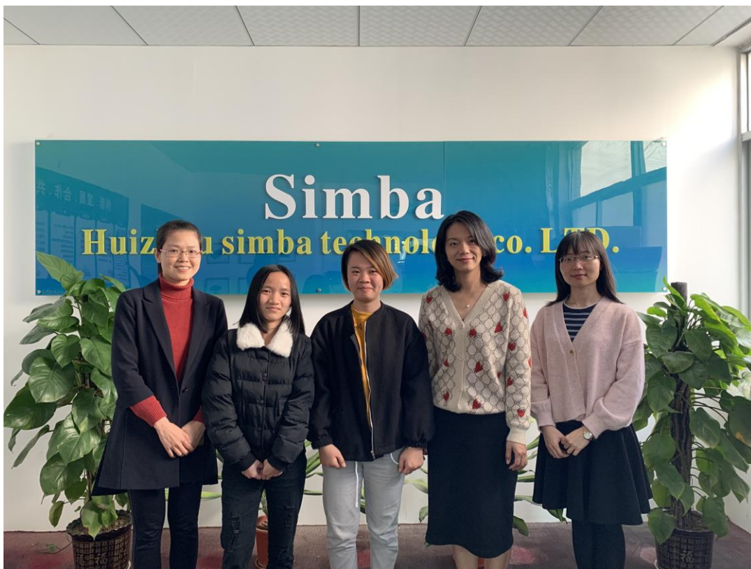
图 8 商务英语专业学生在惠州辛巴科技有限公司集中实习