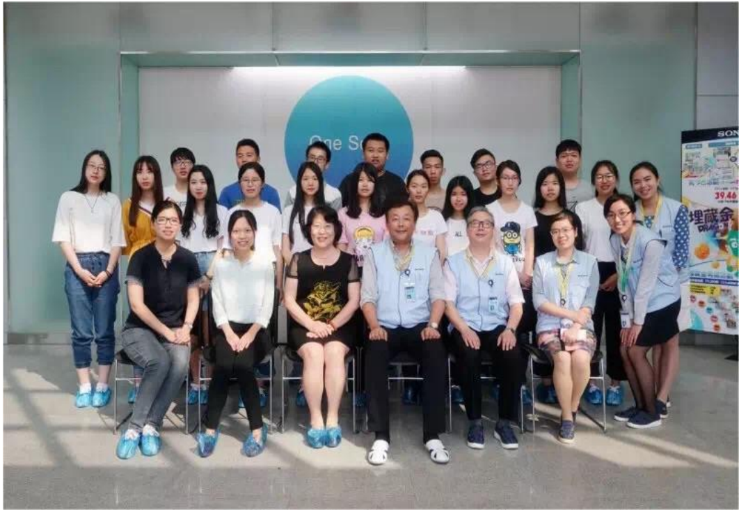
图 22 2016 级商务日语专业学生前往企业索尼精密部件（惠州）有限公司参观