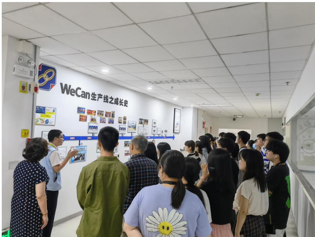
图 25 2019 级商务日语专业学生前往企业索尼精密部件（惠州）有限公司参观