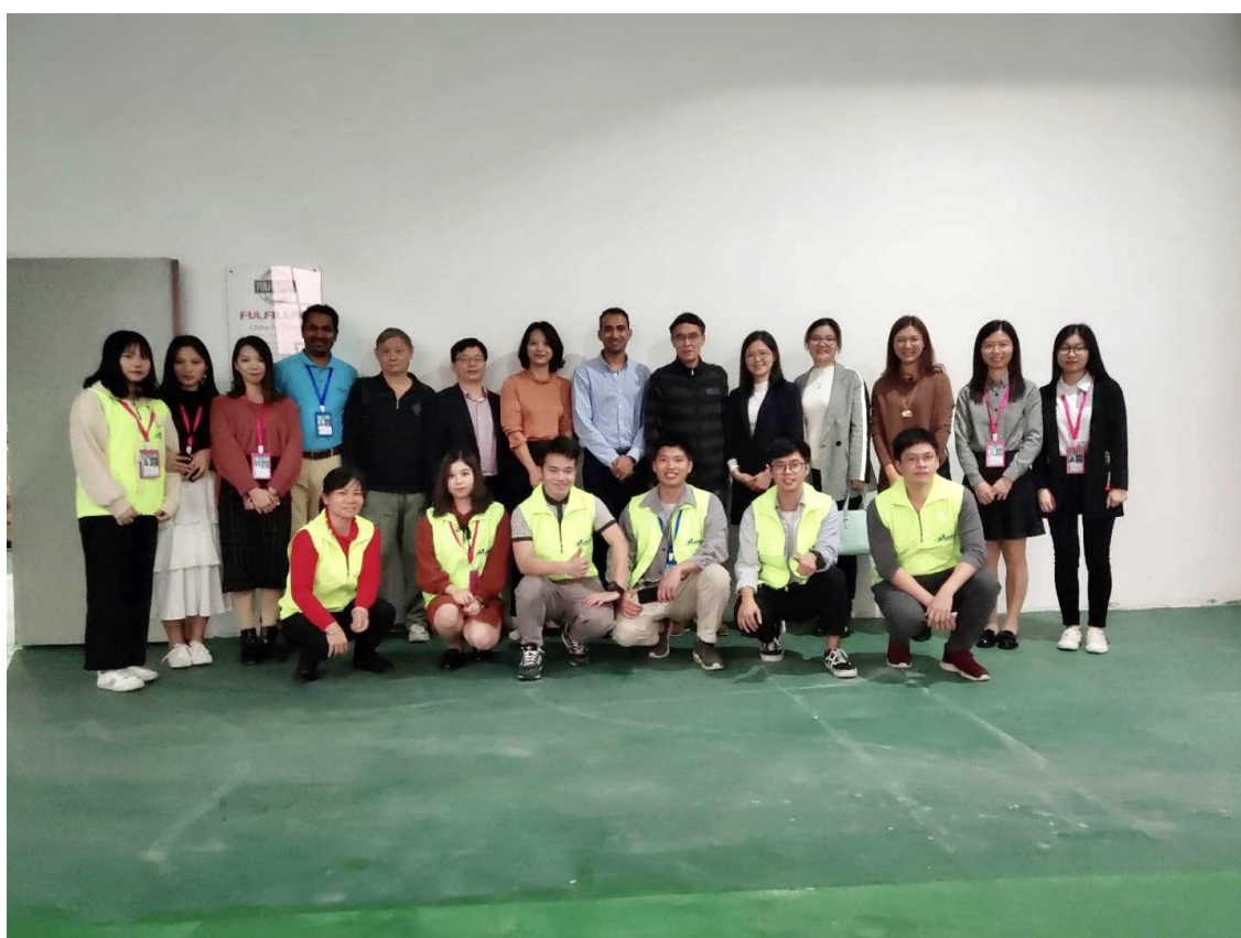
图 5 2018 年商务英语专业学生到深圳市中田物流有限公司轮岗实习