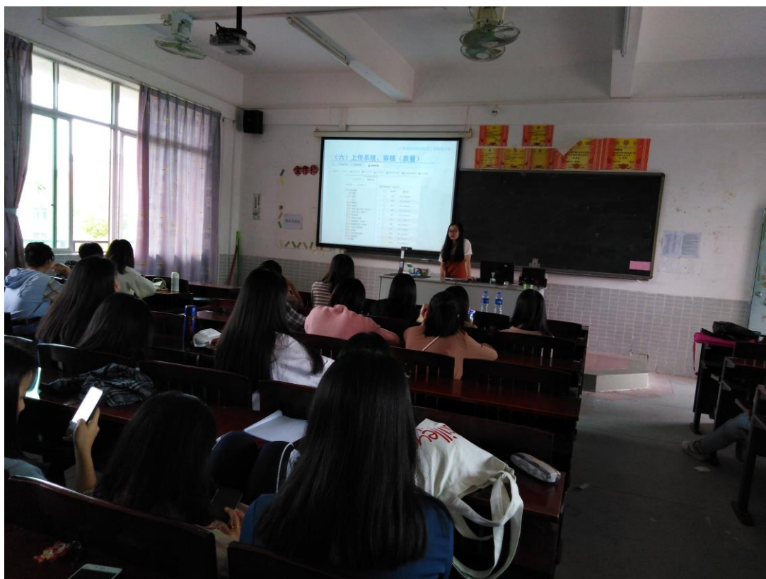
图 9 麦科瑞地理信息工程有限公司来校给文秘专业学校上档案管理实训课