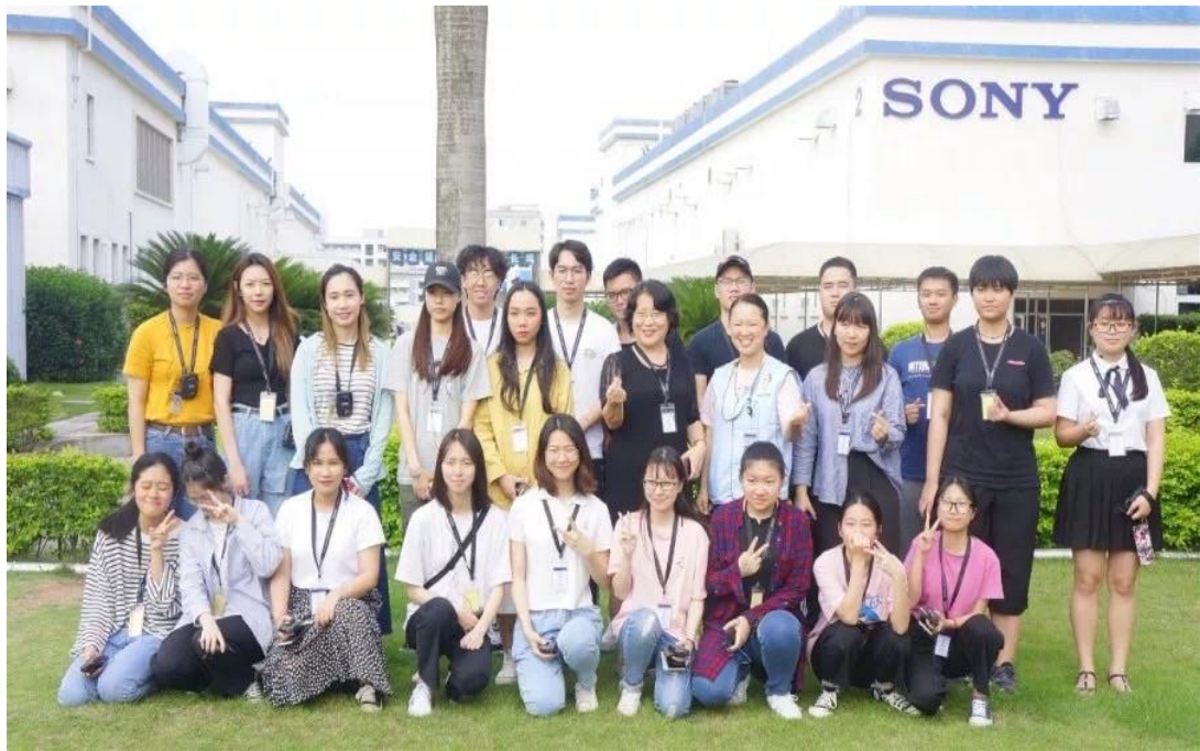
图 23 2017 级商务日语专业学生前往企业索尼精密部件（惠州）有限公司参观