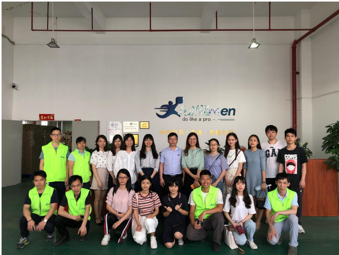
图 6 2019 年商务英语专业学生到深圳市中田物流有限公司轮岗实习