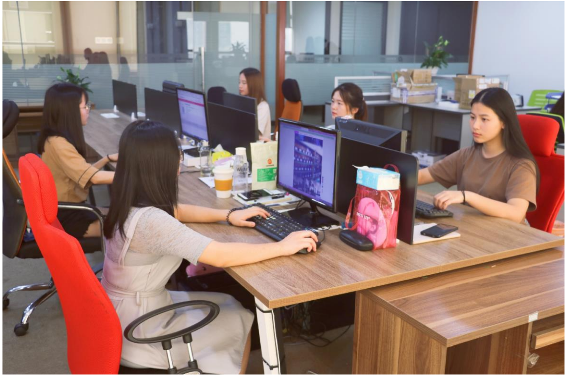
图 2 2016 级商务英语专业学生在惠州市凯创兴科技有限公司集中实习