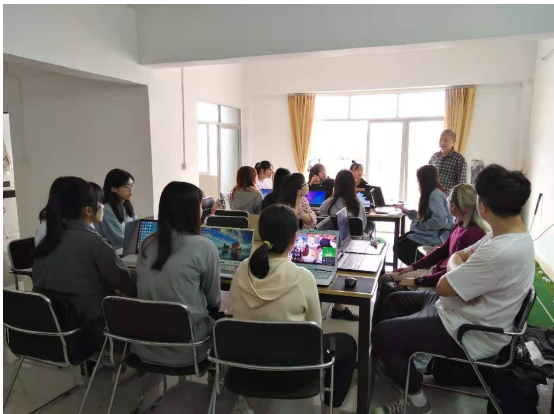
图 4 学生团队参加日本 GS 有限公司亚马逊平台运营培训